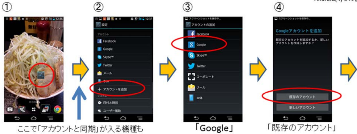
ここで「アカウントと同期」が入る機種も